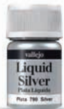
70.790 Plata Silver