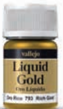
70.793 Oro Rico Rich Gold