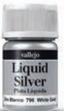
70.796 Oro Blanco White Gold